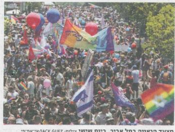
מצעד הגאווה בתל אביב, ביום שישי ב-10/6/2014

מיגרו האפליה תוך קידום הגיוון ופתיחות הדעת, ברוב של מתן תחושה כבוד, שיטת נוחות כאן רגול, לקהילת הלהט"ב בפרט ועד ברי החברה בכלל, מתן זחס שוויוני לכל חברי קהילת הלהט"ב, שיטח סביבת עבודה המקרבת כבוד ומי עוררת גיחון.